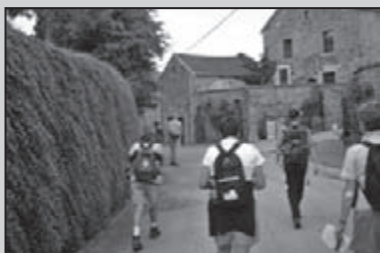
Ardennen Clubreis 28-30

De 'Reus van de Apennijnen' maakte veel indruk tijdens de Vrijwilligersdag