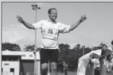
Centurion race op Isle of Man 9-10