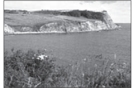
Bloemen i.p.v. koolzaad

Het kustpad naar de volgende plaats, Sandsend, loopt terzijde van verlaten-