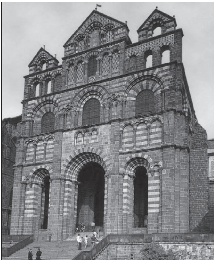
De kathedraal Notre Dame in le Puy

Ik geloof dat we jullie de vorige keer in Conques hebben achtergelaten. Dat lijkt al ontzettend lang geleden. Zo hard als we Conques zijn ingedaald, zo hard moesten we er ook weer uitklimmen. We komen langs de chapelle de