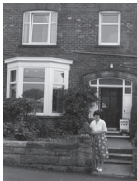
B&B in Robin Hoods Bay