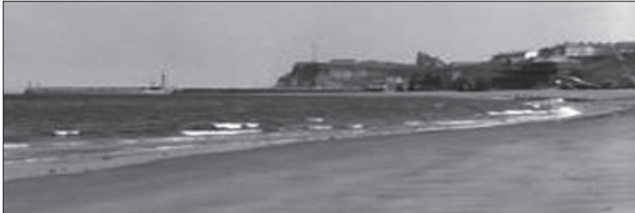
Strand bij Whitby

geet dat maar gauw, want barrevoets met de schoenen in de hand en een rugzak als ballast blijkt het toch geen lolletje te zijn, dus schoenen weer aan en op naar de wat hardere zandplaat. Maar ook dat eist zo z'n tol: het alsmaar zuigende zand vreet energie en op den duur slaat de vermoeidheid toe. Naarmate Whitby dichterbij komt, begint bovendien het water in snel tempo te stijgen en verdwijnt het strand zien-derogen. Maar nu slaat het geluk toe!