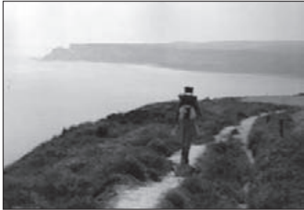
Still going strong

Het verhaal gaat, dat er bij de 'look-out' 1) op de zuidelijke cliffs bij het verlaten van Staithes bijna altijd mensen staan om te genieten van het betoverende uitzicht over de haven en het lieflijke plaatsje. Klopt kennelijk want wij zijn niet de enigen. Mag het, de 58 km lange kustlijn van Saltburn-at-the-Sea tot Scalby Ness bij Scarborough is niet voor niets in 1970 uitgeroepen tot de beschermde 'Heritage Coast' met verrassende uitzichten te over.